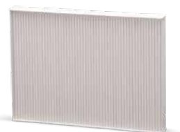
Avec entretien de la clim