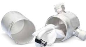
Avec entretien de la clim