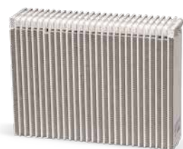
Avec entretien de la clim

La bouteille déshydratante élimine les impuretés du fluide frigorigène et retient l'humidité contenue dans le circuit. Mais sa capacité est limitée, d'où la nécessité de la remplacer à titre préventif dans les véhicules plus anciens et/ou si le kilométrage est élevé, pour protéger la climatisation contre les dommages causés par l'humidité dans le système.