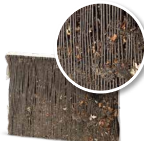
Sans entretien de la clim