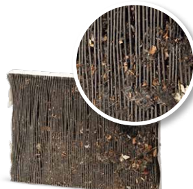
Klimatyzacja bez serwisowania