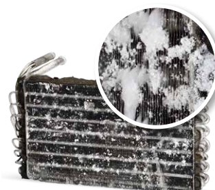
Klimatyzacja bez serwisowania