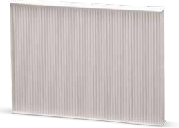
Klima bakımı ile