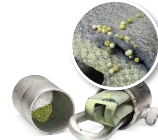
Klima bakımı olmadan