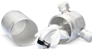
Klima bakımı ile