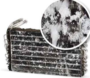
Klima bakımı olmadan