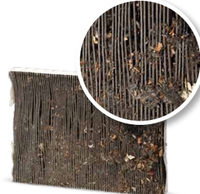
Klima bakımı olmadan