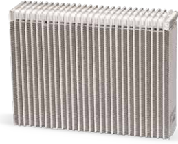
Klima bakımı ile

Düzenli olarak bakımı yapılan ve iyi çalışan bir klima sistemi, elektrikli ve hibrit araçlarda sıcaklığa duyarlı cer bataryasının soğutulmasında da önemli bir rol oynar ve bataryanın uzun ömürlü olmasının yanı sıra aracın menzilinide olumlu yönde etkiler.